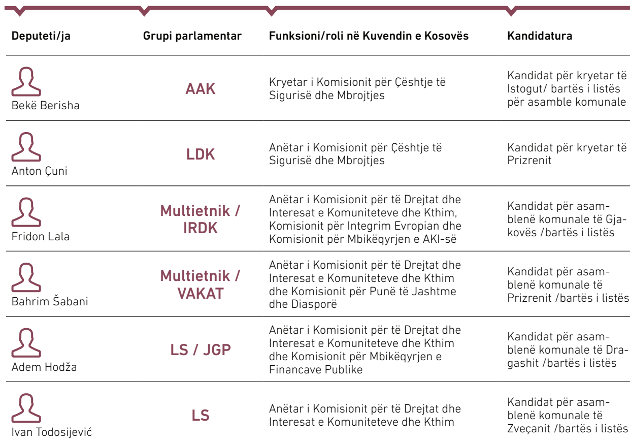
Fig 1. Të dhënat për deputetët dhe tashmë ish-deputetët që kanë marrë pjesë në zgjedhjet lokale të ndarë sipas grupit parlamentar, funksionit në Kuvend dhe kandidaturës në zgjedhjet lokale 2021.

Gjashtë nga këta deputetë – kandidatë për kryetar komune janë deputetë që kanë pasur edhe funksione udhëheqëse brenda trupave të punës së Kuvendit. Duke marrë parasysh rolin e rëndësishëm që kanë kryetarët e grupeve parlamentare në punën e Kuvendit dhe mbarëvajtjen e punimeve plenare, mos prezenca e tyre e rregullt në Kuvend ka ndikuar drejtpërdrejt në mbarëvajtjen e përgjithshme të punimeve të Kuvendit. Po ashtu, duke qenë se edhe kryetarët e komisioneve parlamentare kanë kompetencë për thirrjen e mbledhjeve të komisioneve, të kryesimit dhe caktimin e agjendës së atyre takimeve, mungesa e angazhimit të tyre në kryerjen e këtyre detyrave ka ndikuar në dinamikën e punës së komisioneve përkatëse.